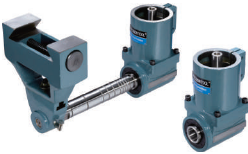
Modelo: Cabeçote NT-40 (02787)